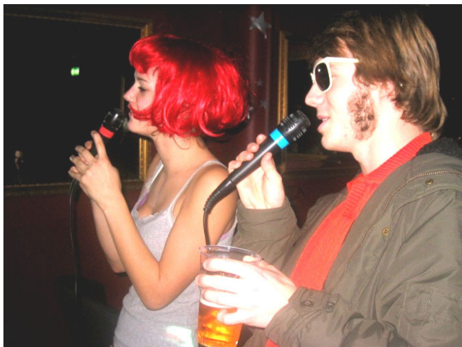
ASF'ere synger ikke så ofte, men på lørdag gjorde de det.

tisk nesten fullt i det lille rommet. Vinnerne blir premiært med sølvstjerner i ansiktet. Men tilslutt har omtrent alle